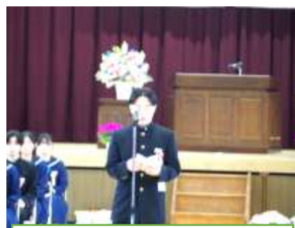
卒業生株立ちの言葉：〇〇〇〇さん