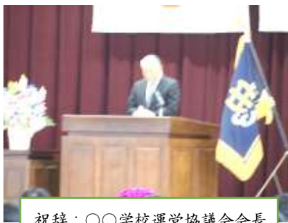
祝辞：〇〇学校運営協議会会長