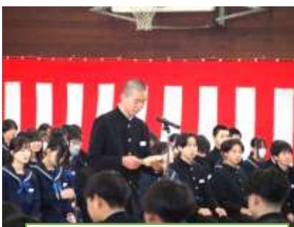
在校生送る言葉：〇 〇〇さん