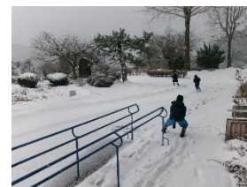
さっそく雪遊びの子どもたち