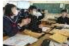
1年生グループ学習

自治組織である生徒会活動を行います。 生徒会活動は自主性がなければ、 成立しない活動です。また、一中生は、 つながりを大切にしている なあと日々感じます。四大祭と言われる学校行事をつながることで楽しみ、盛り上げる姿があります。また、授業中に「ペア学習」「グループ学習」を行うと、誰とでもすぐに活動できる、協働できる雰囲気があります。