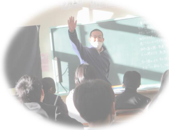
関連の本を貸し出ししました。

人権週間（12月4日から14日）は、朝読書時間を使って先生方が10分間生徒の皆さんに伝えたい人権に関連する話をされました。（自分も周りの人も大切に、命を大切に、家族の絆、思い込みの怖さ、など）