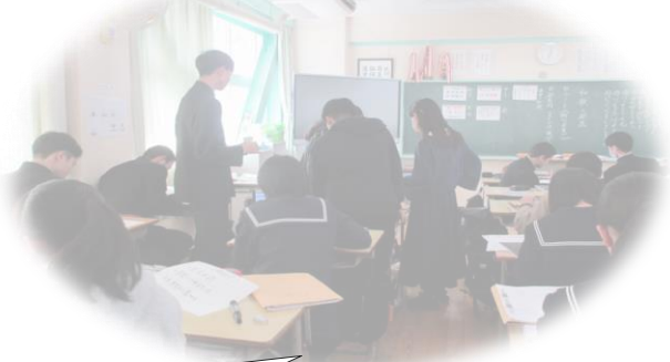
3年生 国語科 「おくのほそ道」 図書館活用 授業の様子