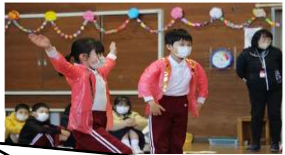
5 各学年からの出し物 どの学年も工夫され、6年生への想いに満ちた発表でした！