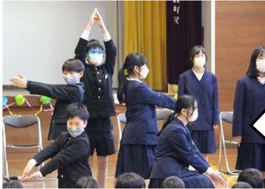
6 6年生からの出し物 1年生から5年生に、エールを送ってくれました！