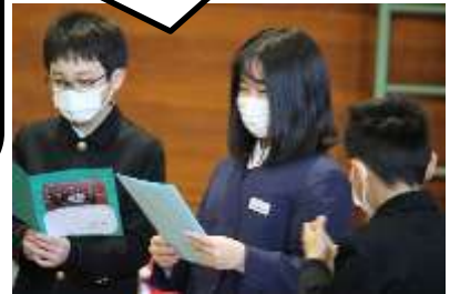
7 メッセージ渡し 班ごとにメッセージを渡しました。しっかり読んでくれていますね！