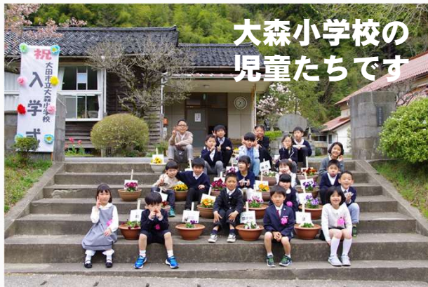
大森小学校の 児童たちです