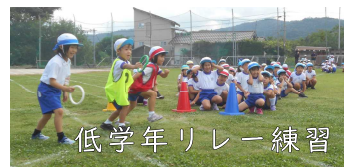
低学年リレー練習

短い準備期間、コロナ対策での活動制限、台風による臨時休校と、子どもたちには厳しい状況となっていますが、スローガンの言葉通りの運動会となるようみんなで力を合わせて最後の仕上げをがんばっています。