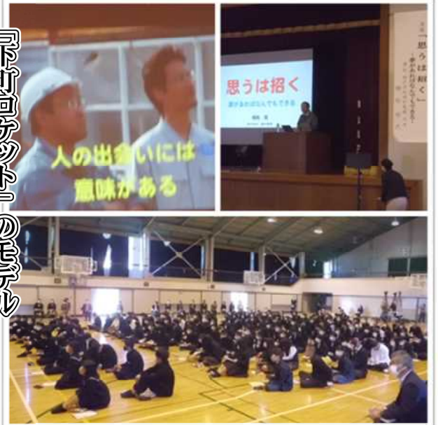
11月1日（月）、邇摩高に行きました。 三中や邇摩高の生徒と多くを学びました。