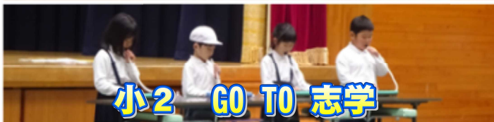
小2 GO TO 志学