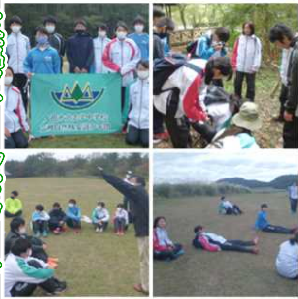
10月29日（金）、三瓶山を一周しました。 学習+レクで楽しく過ごしました。