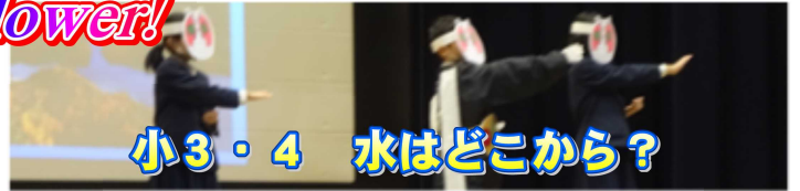
小3・4 水はどこから？