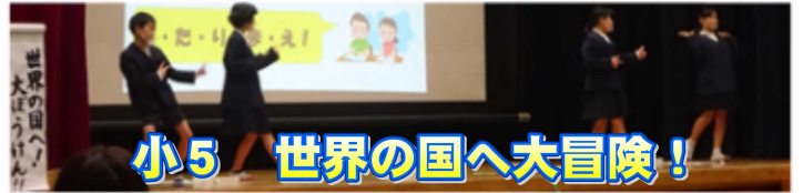
小5 世界の国へ大冒険！