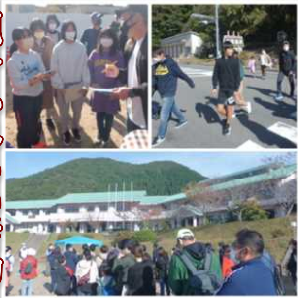
10月24日（日）、昨年に引き続いて歴史 探訪健康ウォーキングを満喫しました。