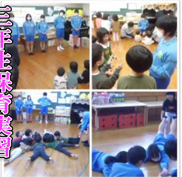
11月10日（水）、中学生が手製の遊具 を作り、園児と楽しく活動しました。