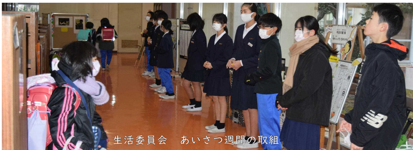
生活委員会 あいさつ週間の取組

8月31日(火)にスタートした2学期、早いものであと1週間で終業式を迎えます。この2学期、子どもたちにはたくさんある学校行事にめあてを持って臨み、大きな成果を上げてほしいと話していました。2学期を終えるにあたって少し振り返ってみます。