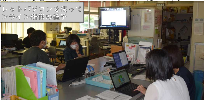
タブレットパソコンを使ってのオンライン研修の様子

全員での研修以外にも、個人で様々な研修会に参加しました。2学期からの学習に活動に生かしていきたいと思います。