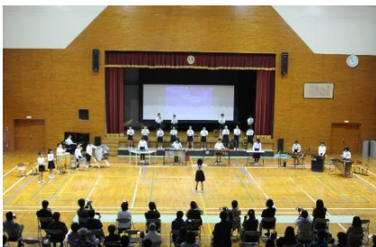
4年「きらっきらの27の楽器」 1年「こんなことができるようになったよ」