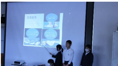
5年「大田市の工業について発表しよう」