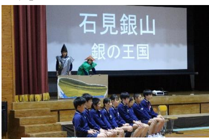
6年「大田の宝 石見銀山」