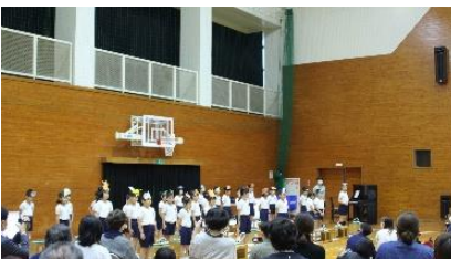
2年「動物のひみつを調べたよ」