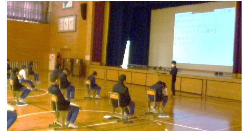
《5年生の発表の様子》

この1年でたくさんの勉強をし、知識だけでなく、多様な考え方もできるようになりました。