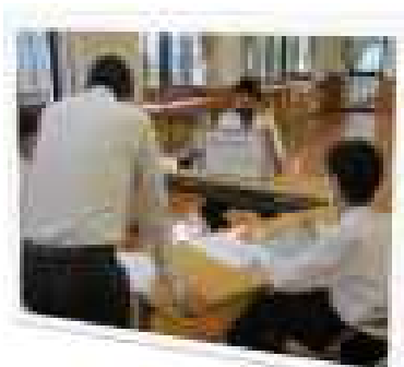
グループでシェアリング

作業を通じて、一人一人が 自分を振り返ったり、新しい 学びや気づきがあったり、 みんなの優しさに包まれた 素敵な時間を過ごしました。