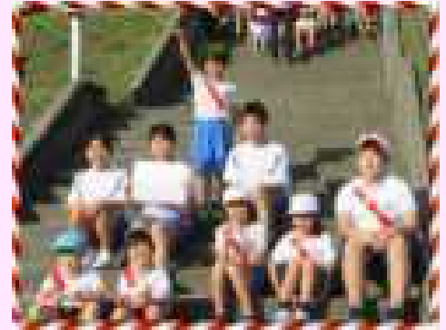
【優勝した赤チーム】

9月28日（月）、爽やかな秋晴れの中、標記の大会を開催いたしました。園児から小学生、そして中学生へタスキを繋ぎ、4チーム全てが完走しました。