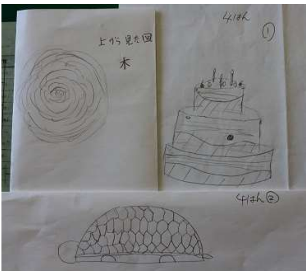
鳥井っ子4班の完成予想図です。