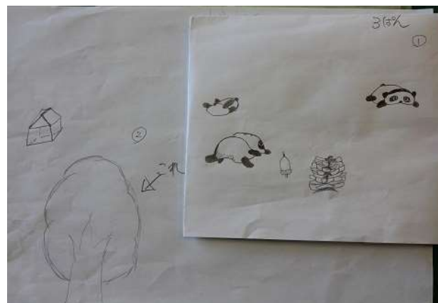
鳥井っ子3班の完成予想図です。