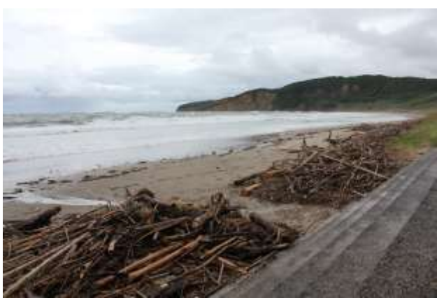
13日朝の鳥井海岸の様子です。波が打ち寄せ、砂浜がほとんど見えません。残念・・・

残念ですが、ここまでいろいろと準備をしてきていただいた研修部の皆さんありがとうございました。また、次の企画、よろしくお願いします。