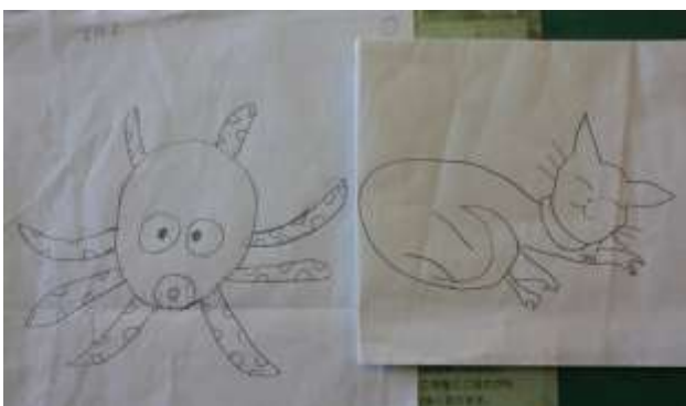
鳥井っ子2班の完成予想図です。