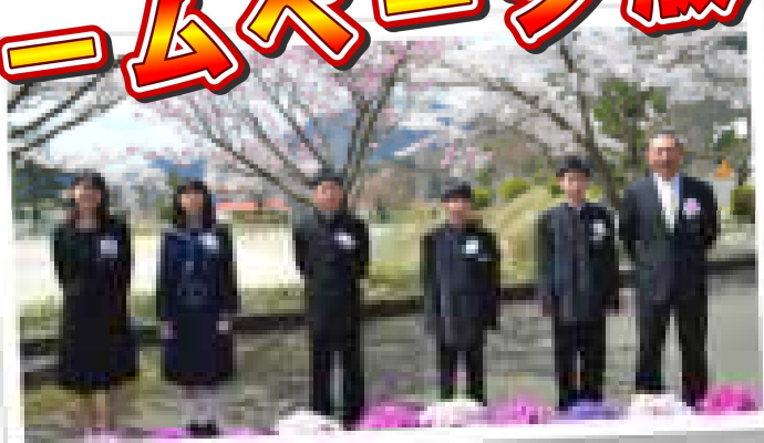
4名の元気な新入生を迎え、全校生徒数は14名となりました。

令和2年度も生徒の皆さんが、 「学校に行きたいなあ」 「授業が楽しいなあ」 「友だちも先生たちも大好きだ」 と思える学校に、そして保護者や地域の皆さんが、 「志学中は安全・安心だ」 「また立ち寄りしたいなあ」 と感じてもらえるような学校をめざしたいと思います。