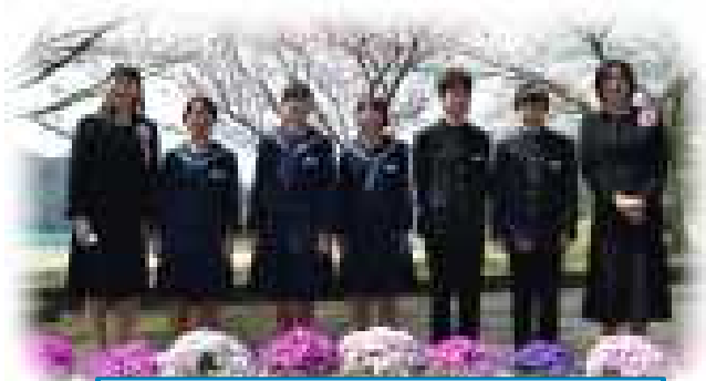
さわやか「新2年生」です。