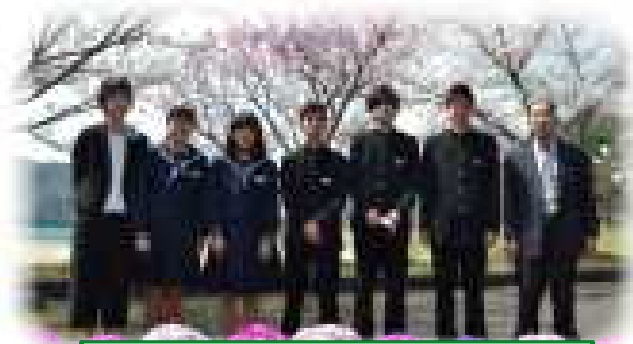
心強い「新3年生」です。